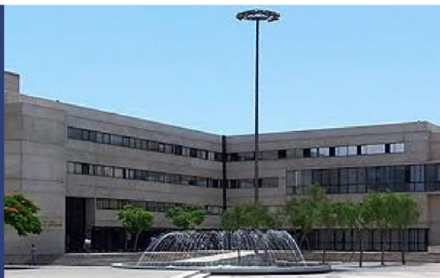
Universidad Nacional Mayor de San Marcos